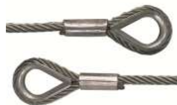
met kous beide zijden