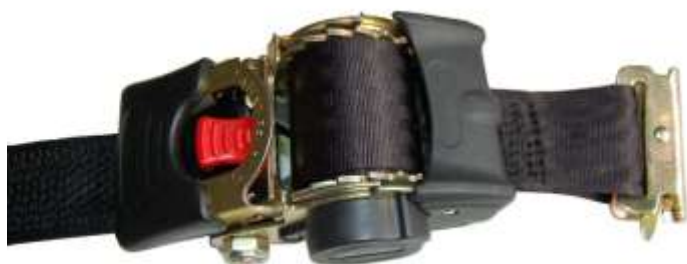
Spanband met euroclip, detail