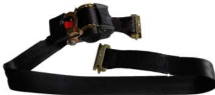
Spanband met euroclip

Toepassing: Lading vastzetten in gesloten trailers en koeltrailers.