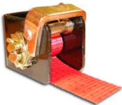
Winch met U-vorm montageplaat voor bandbreedtes tot 50mm