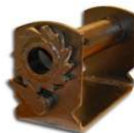
Winch met U-vorm montageplaat voor bandbreedtes tot 100mm