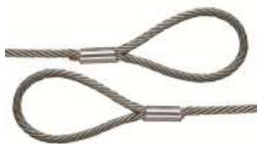
met lus beide zijden