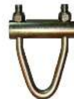
Triangel Art.-Nr. 20T TR750120