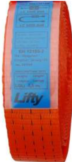
PVC-hoes, lichte kwaliteit