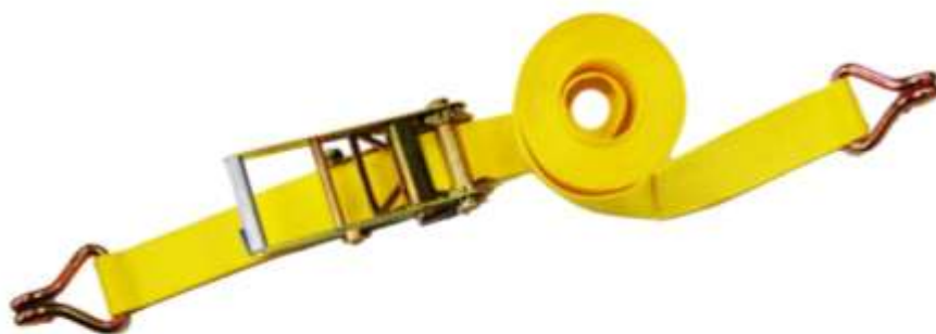
Sjorband 2-delig voorzien van haken