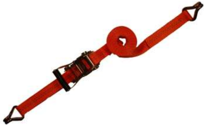
Sjorband 2-delig voorzien van haken

Toepassing: Het vastzetten van lichte lading.