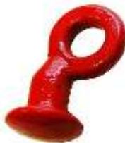
Olifantspoot Art.-Nr. TOL7501