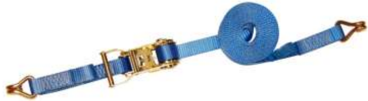
Sjorband 2-delig voorzien van haken