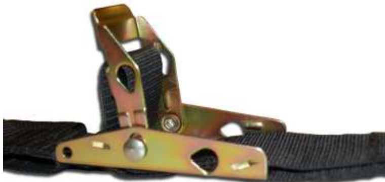
Omklapgesp (overcenter buckle)