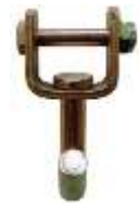
draaibare vingerhaken voor aan band