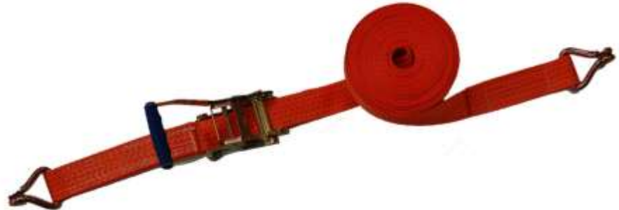
Sjorband 2-delig voorzien van haken