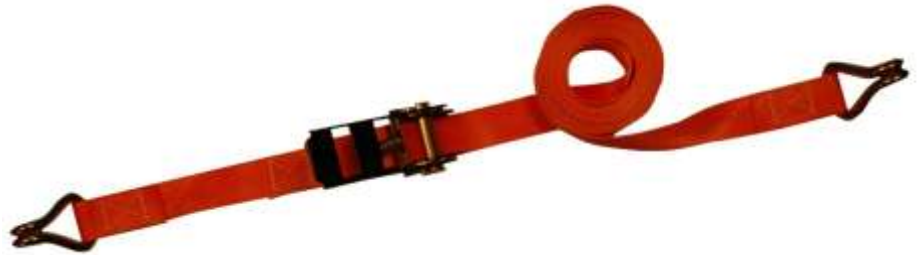
Sjorband 2-delig voorzien van haken