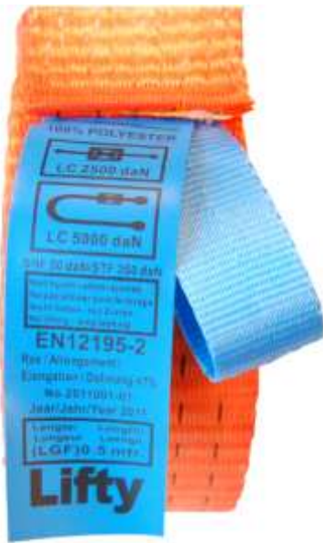
Label bevestigd met bandje IMO-jaarkleur