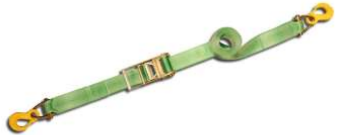
Sjorband 2-delig voorzien van haken