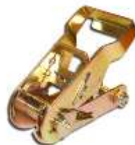
Ratel LC 1500 daN RA2702