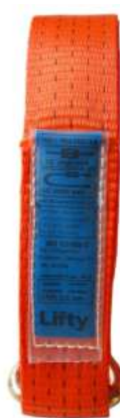
Label in PVC-hoes vastgenaaid