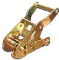
Ratel LC 1500 daN RA2701

Lengtes kunnen naar wens worden geproduceerd.