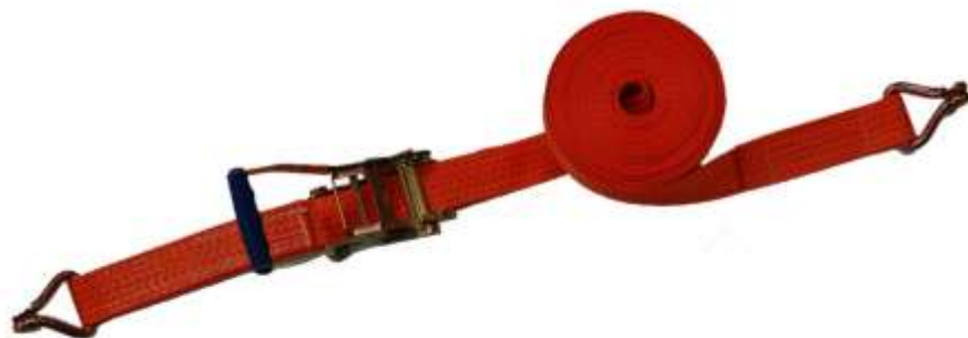
Sjorband 2-delig voorzien van haken