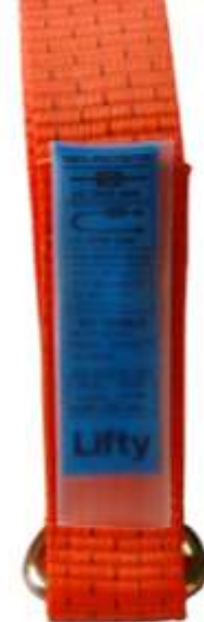
PVC-hoes, sterke kwaliteit