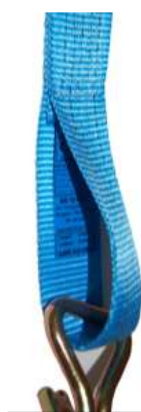
Label in lus vastgenaaid